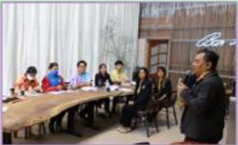
1. เครือข่ายวิทยุชุมชน (วิทยุทะเล-วันเมืองงาม 23 สถานี)

ตัวอย่างการเผยแพร่ไปยังเครือข่ายต่างๆ จำนวน 3 เครือข่าย