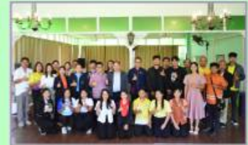
3. เครือข่ายภาคประชาชนจังหวัดพิจิตร