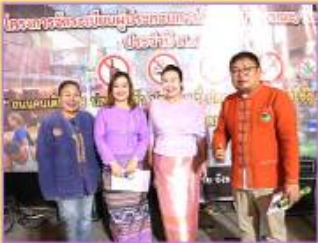
4.1 ด้านนโยบาย

มีผลลัพธ์การปฏิบัติงานที่นำไปสู่การเปลี่ยนแปลงในระดับต่างๆ