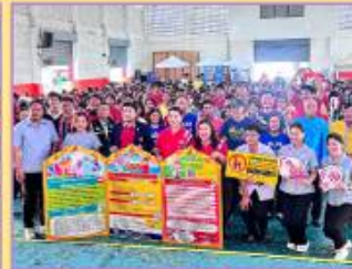
4.4 ด้านรณรงค์ สื่อสาร ประชาสัมพันธ์