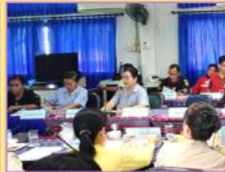
4.3 ด้านวิชาการ วิจัย