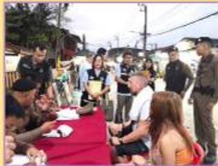
4.2 กฎหมาย การเฝ้าระวัง บังคับใช้กฎหมาย