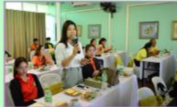
2. เครือข่ายอาสาสมัครประชาสัมพันธ์ประจำหมู่บ้านและชุมชน (อป.บ.ช.)